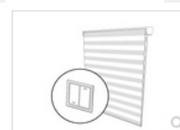
MOTORIZADO INTERRUPTOR DE PAREDE