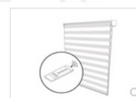
MOTORIZADO COM COMANDO SEM FIO

Motorizado: Sistema com o motor para interruptor (Interruptor do cliente) - no local da instalação tem que ter um ponto de energia com ligação ao interruptor (5 fios – Fase/Neutro/Terra/Subida/Descida), decidir na compra o lado do ponto de energia (Esquerda / Direita), o motor é fornecido com 3 metros de cabo.